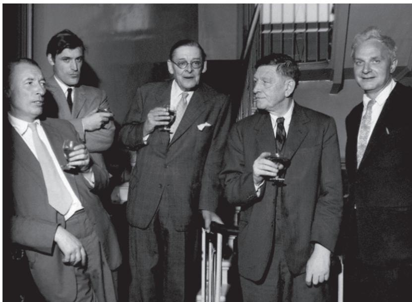
S lijeva na desno: Louis MacNeice, Ted Hughes, T. S. Eliot, W. H. Auden, Stephen Spender